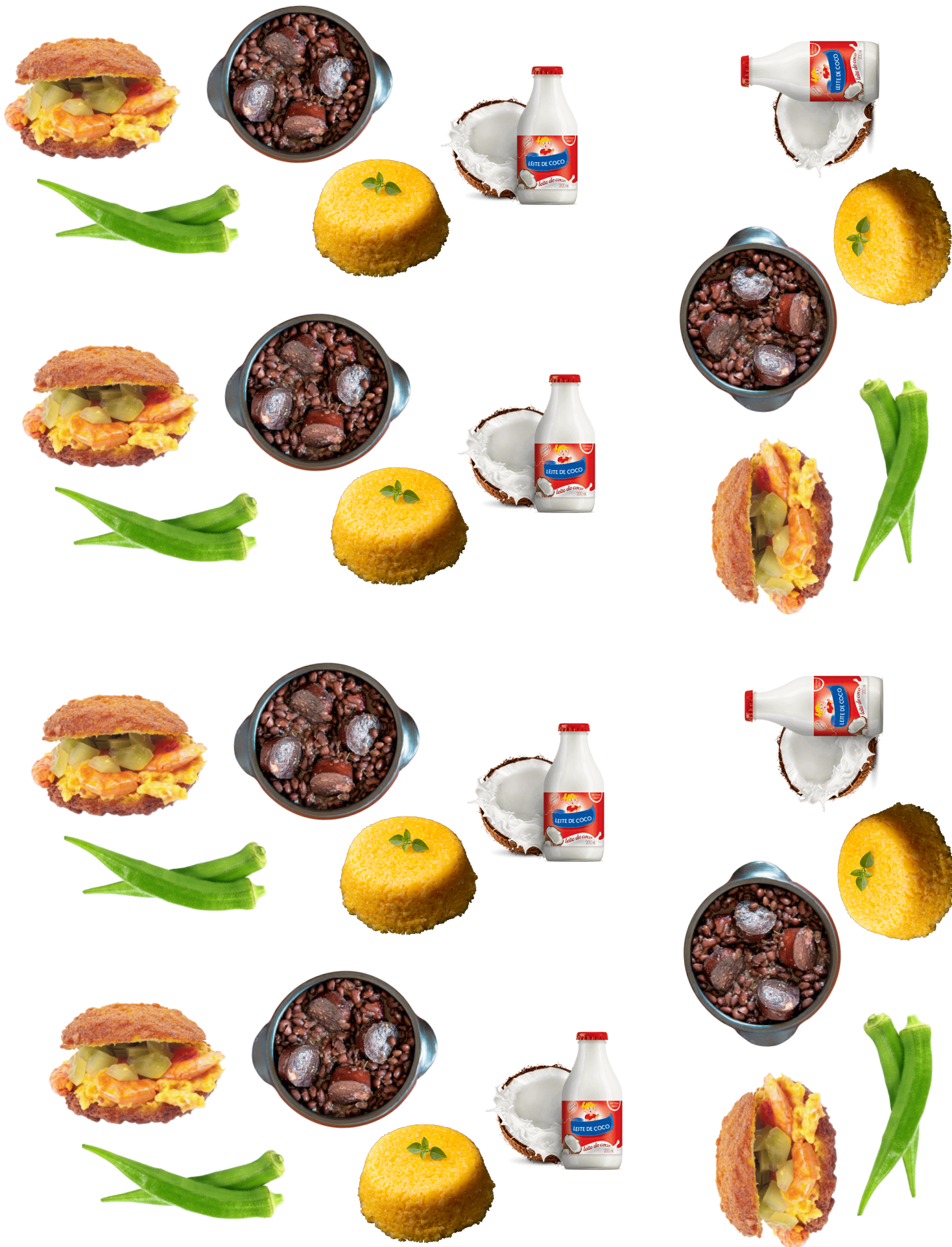
ALIMENTOS PEQUENOS PARA ATIVIDADE EM FOLHA.